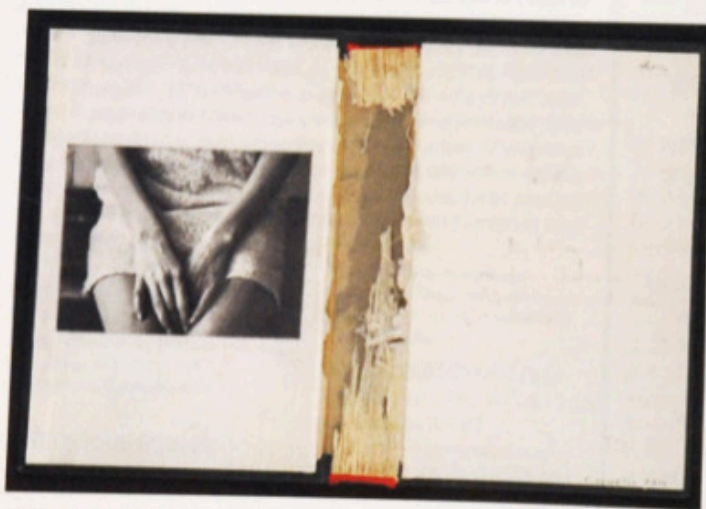
CHRISTOS VENETIS CV/P 89

D'une exactitude hyperréaliste, un voile noir et blanc alimentant un léger flou érotisant, le dessin de cet artiste grec se niche au revers de la couverture d'un livre au contenu arraché. Grain du papier et inscription décentrée en font toute la suave étrangeté. 2016, crayon sur couverture de livre, 21 x 31,5 cm. Galerie Martin Kudlek, Cologne - Drawing Now